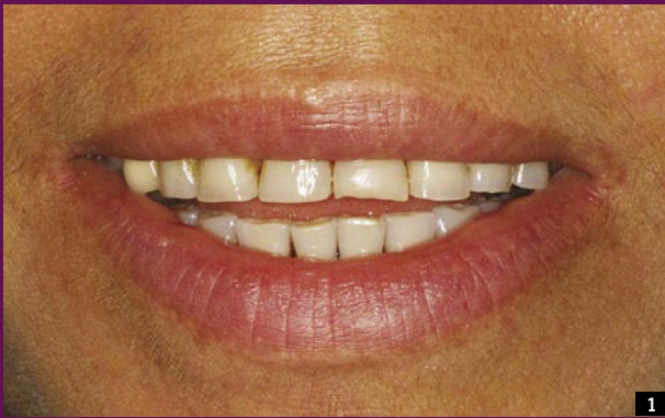
1 PRZED LECZENIEM