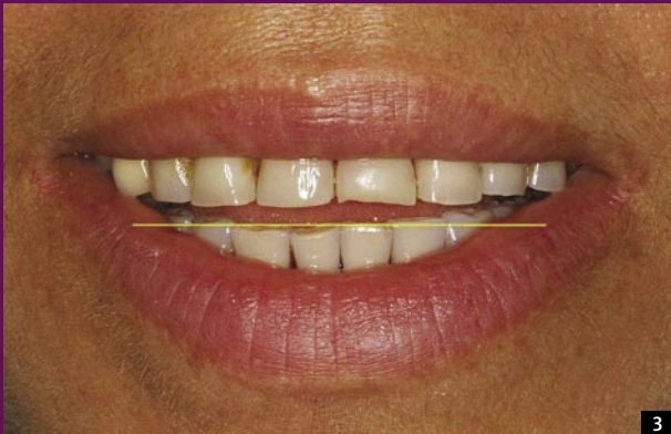
3 LINIA UŚMIECHU PROSTA