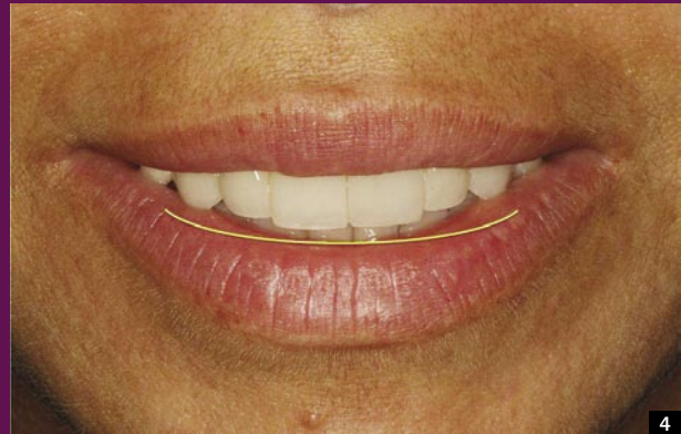
4 LINIA UŚMIECHU SYMETRYCZNA DO WARGI DOLNEJ

podstawowym sposobem leczenia na całym świecie.