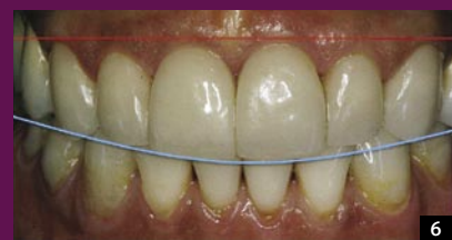
6 LINIA PRZEBIEGU DZIĄSEŁ PO LECZENIU