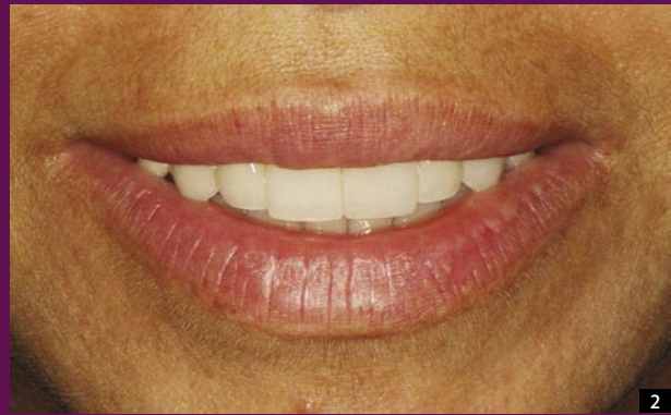
2 PO WYKONANIU LICÓWEK PORCELANOWYCH