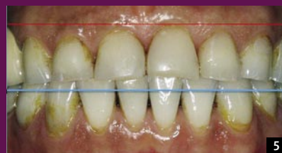
5 LINIA PRZEBIEGU DZIĄSEŁ PRZED LECZENIEM

ponieważ nikogo nie zachwyci jeden ząb ciemny, a drugi zbyt jasny. Uwagę naszą zwykle przykuwa jakiś defekt, może to być za duży nos, złamany ząb czy niedoskonała cera. Niestety, nasza uwaga skupia się również na karykaturalnie „poprawionych” częściach naszego ciała, na przykład zbyt białych, nienaturalnych zębach. Nie ma wtedy równowagi, z estetyką niewiele ma to wspólnego. Wygląda na to, że piękno zawarte jest w harmonii, gdy wszystkie elementy wizerunku są w równowadze.