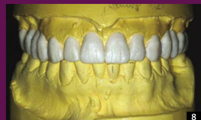
8 WSTĘPNA SYMULACJA NOWEGO KSZTAŁTU ZĘBÓW NA MODELU GIPSOWYM